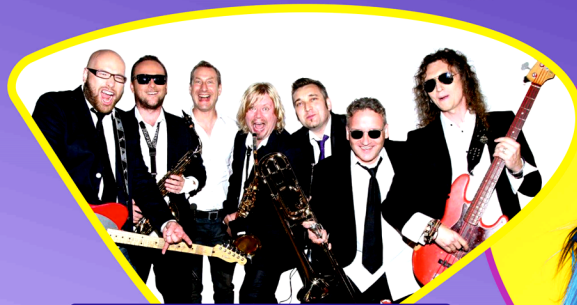
POPARZENI KAWĄ TRZY